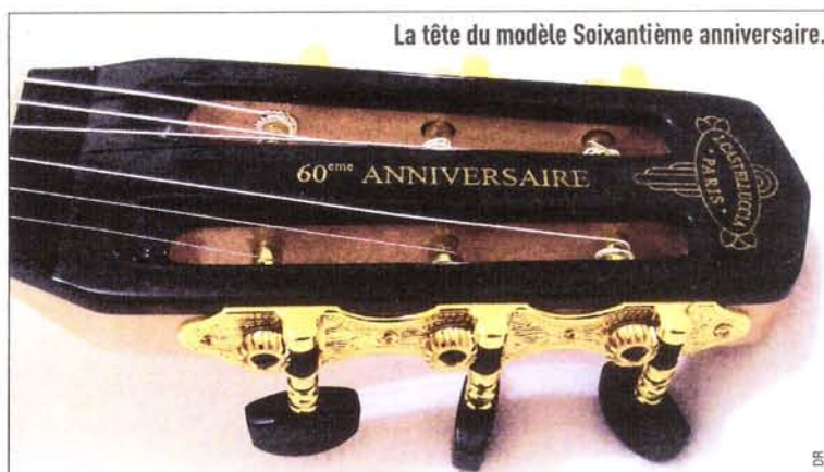
La tête du modèle Soixantième anniversaire.

Oui, et nombre d'entre eux étaient basés dans le vingtième arrondissement de Paris et à Montreuil. Mon grand-père était lui installé porte de Montreuil, face à une place où à l'époque stationnaient les gens du voyage.